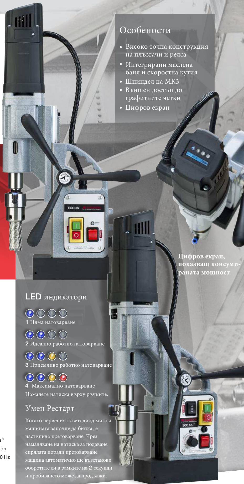
Цифров екран, показващ консумираната мощност